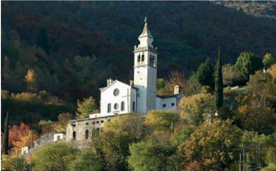
Il Santuario di San Francesco da Paola sopra Revine Lago

Franco Trifuoggi in “l’impegno”, Anno XXXII- N. 3 - Maggio – Giugno 2012, p. 4