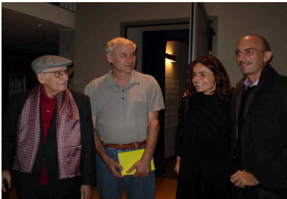
(©) Andrea Zanzotto, Luciano Cecchinel, Alessandra Pellizzari e Francesco Carbognin

Alessandra Pellizzari, in La parola scoscesa , a cura di Alessandro Scarsella, Venezia, Marsilio 2012, p. 152