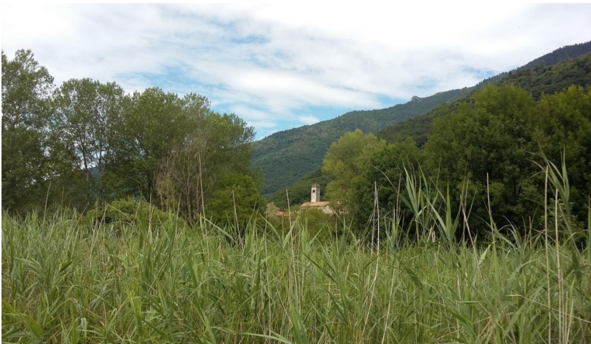
Paesaggio di Lago (Revine) con la vecchia chiesa

Filippo Secchieri, in La parola scoscesa , a cura di Alessandro Scarsella, Venezia, Marsilio 2012, p. 143