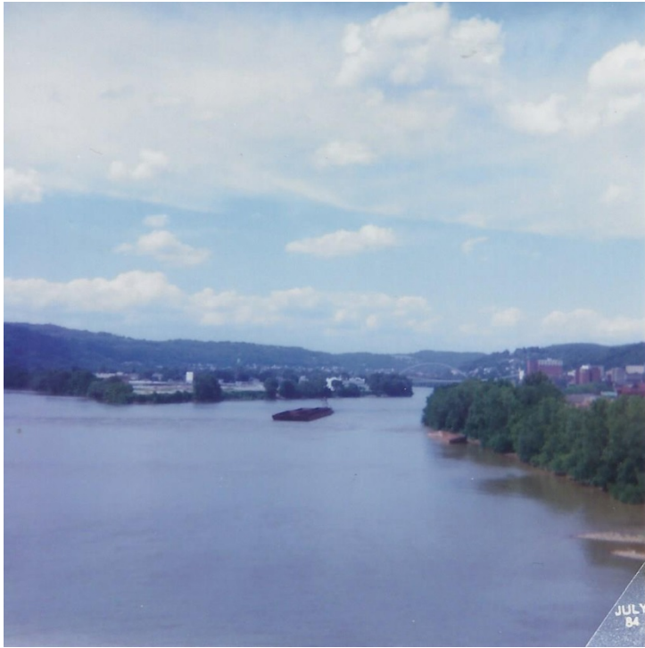
Il fiume Ohio, linea di confine tra gli Stati dell'Ohio e del West Virginia a Wheeling – (©)