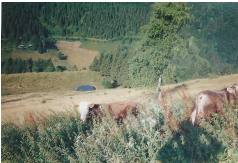
Pascolo con "lama" (pozza per l'abbeverata). Sull'altro versante in corrispondenza della cima della betulla è situato il Bus del Boral

Matteo Giancotti, in La parola scoscesa , a cura di Alessandro Scarsella, Venezia, Marsilio 2012, pp. 39-46