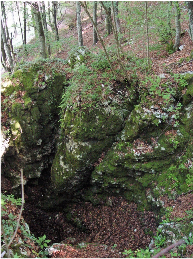
Il Bus del Boral nei pressi delle Crode di Bardiaga