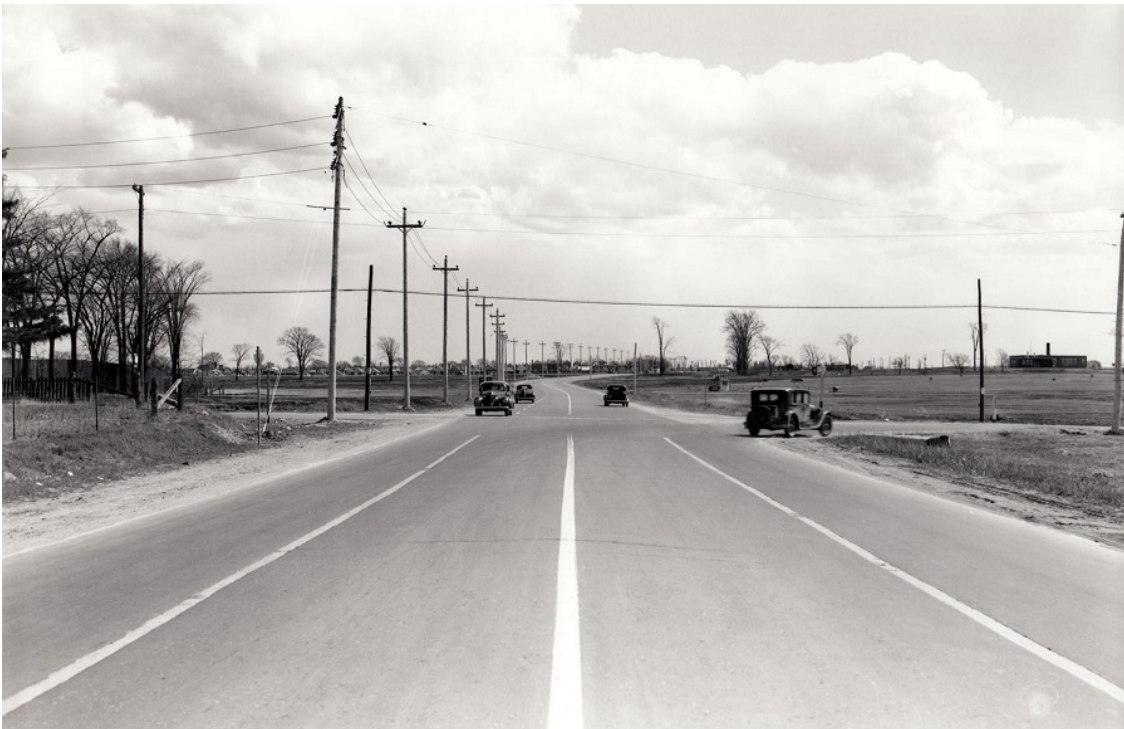
La "Old National Road" nei primi decenni del '900

Andrea Zanzotto, "Yale Italian Poetry", Volumes V-VI, 2001-2002, New Haven, CT, U.S.A. , pp. 17-18