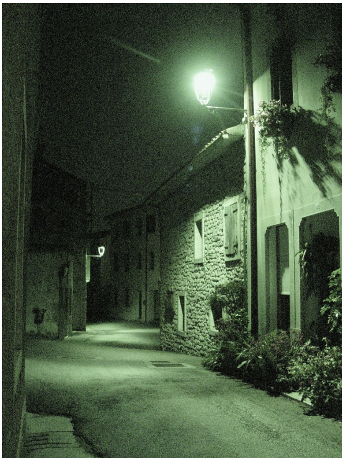
Revine, scorcio notturno

Franco Trifuoggi in "l'impegno", anno XXIX, n. 3, Nola, maggio-giugno 2009, p. 4