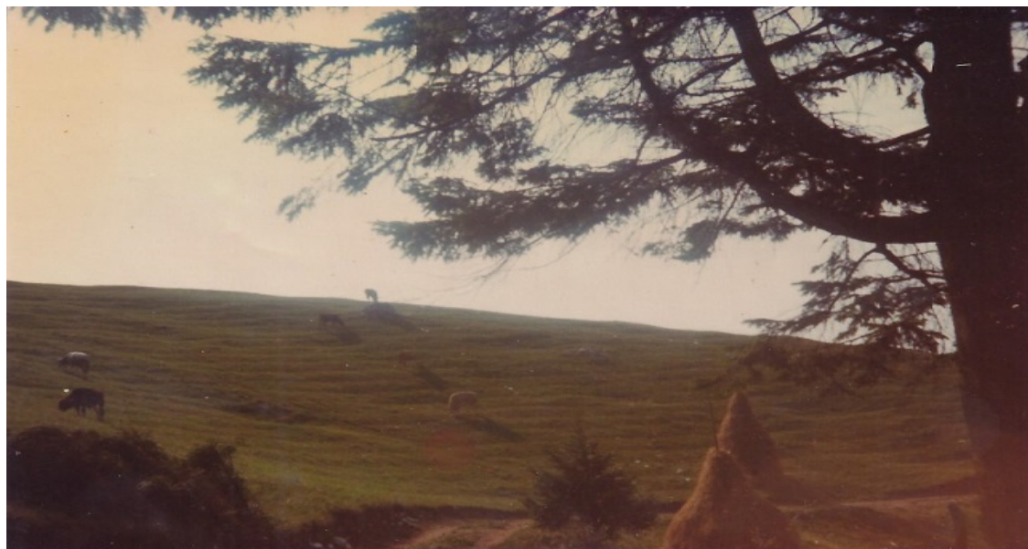
Pascolo con mete di fieno al crepuscolo

Giovanni Turra, "Letteratura e dialetti", 5, 2012, pp. 165-166