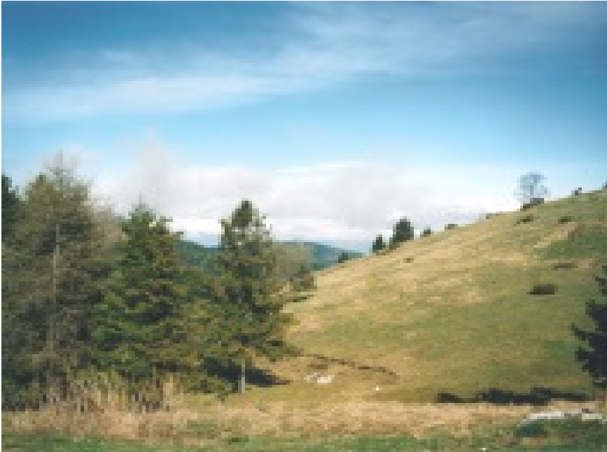
Pascoli sulle cime prealpine sopra Revine

Marco Munaro, Il potere, l'urlo, l'erta strada , Litografia Battivelli, Conegliano 1994, pp. 47-53