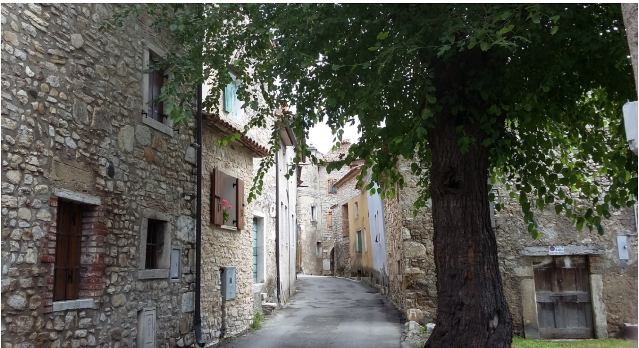
Centro storico di Lago con antico gelso

Elvira Fantin, “L’Azione”, 18 dicembre 2016, pp. 16-17