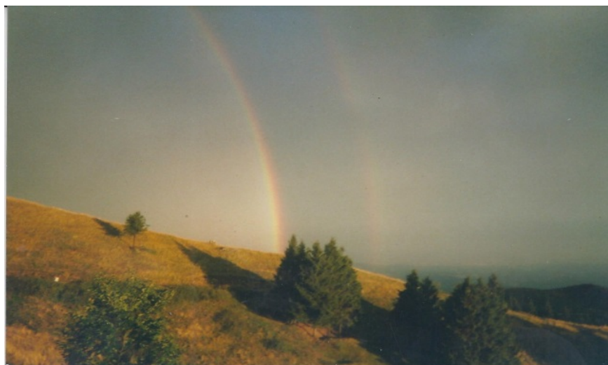
Pascolo sulle Prealpi Revinesi dopo un temporale

Nicolò Menniti-Ippolito, 01 aprile 2012 — Il Mattino di Padova, p. 47 (e in "Il Corriere delle Alpi", p. 26, "la Tribuna", p. 48 e La Nuova di Venezia e Mestre)