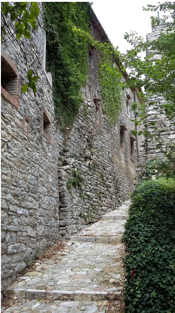
Una stradina che porta al lago (andreóna) nel paese omonimo

[Le sue] scelte espressive paiono riconducibili, prima ancora che a una precisa presa di posizione di natura linguistica e poetica, a una condizione storico-anagrafica parentale, visto che nella casa statunitense ove abitava la madre «il sì / si spegne per la sua dolce voce» ( dentro una piccola