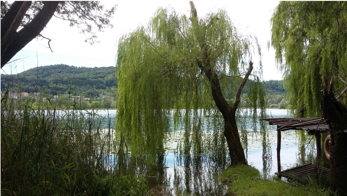
Il lago dell'omonimo paese

Alberto Cellotto, librobreve.blogspot.com/.../sanjut-de-stran-di-luciano-cecchinel.html , domenica 29 aprile 2012