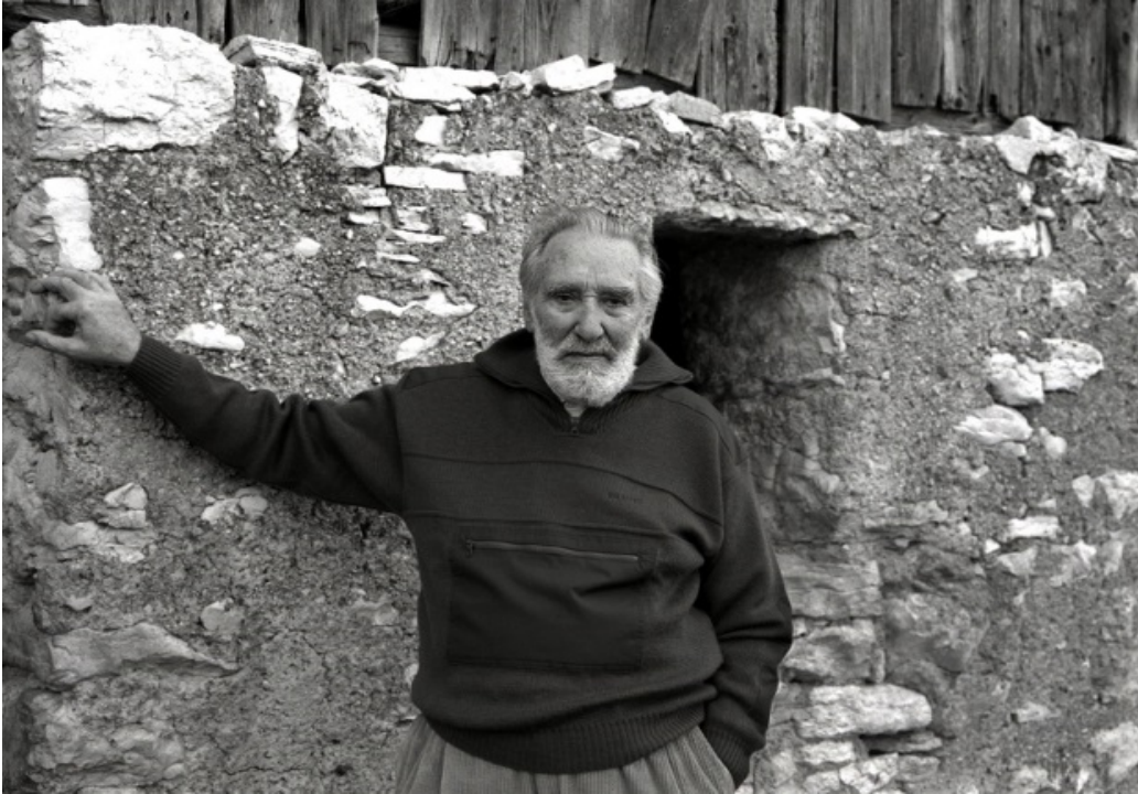
Mario Rigoni Stern