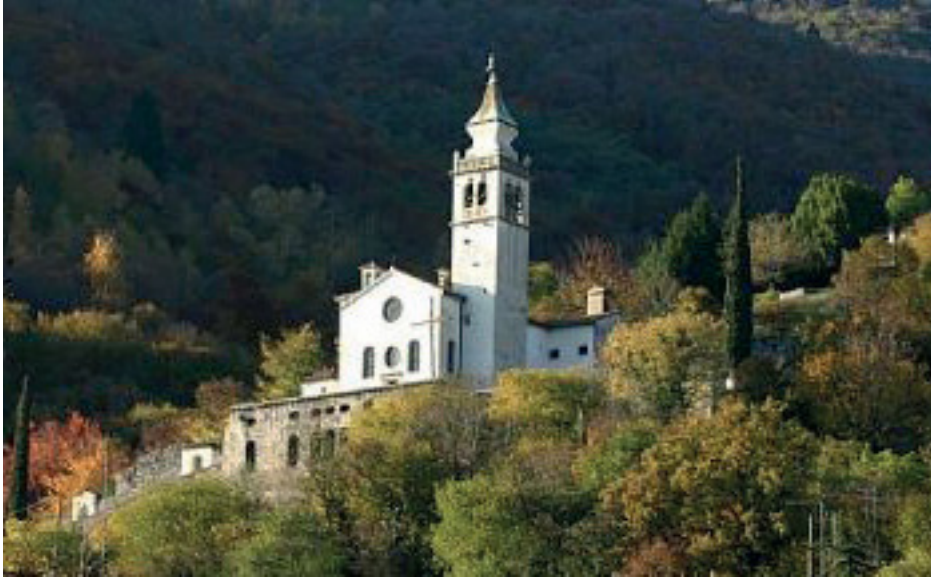
Il Santuario di San Francesco da Paola sopra Revine

Franco Trifuoggi in “l’impegno”, Anno XXXII- N. 3 - Maggio – Giugno 2012, p. 4