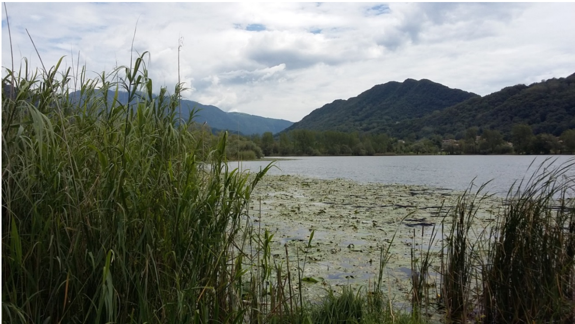
Il lago di Lago verso Santa Maria